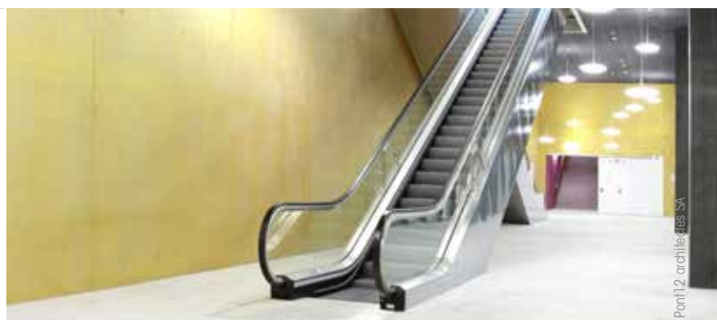
Pont12 architectes SA