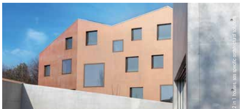
2 in 1 houses, sas specific architectural solutions

Avec faceal Colour Metallic, le béton apparent devient scintillant.